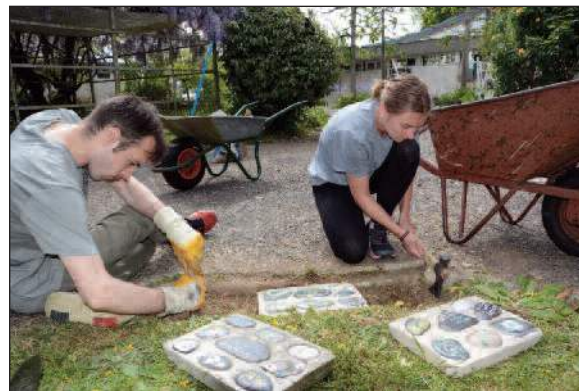
04-07 mai : Chantier jeunes, pose des carreaux réalisés en Irlande.