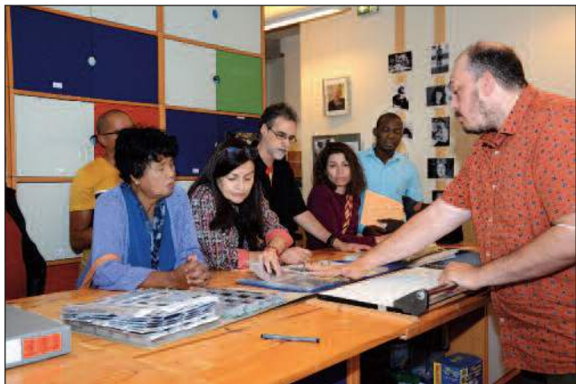
07 juin : Visite de membres du conseil d'administration du mouvement international ATD Quart Monde.