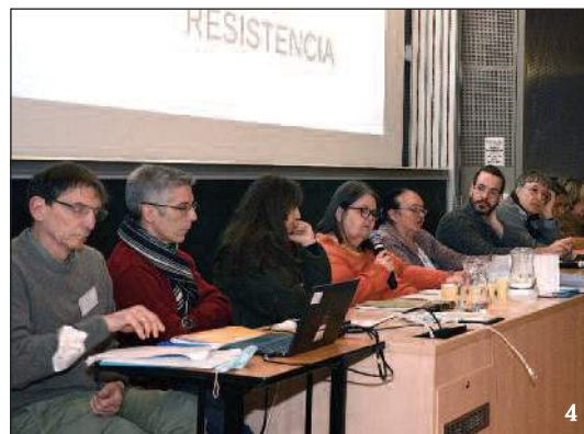
3 et 4 - 09-10 décembre : Colloque de clôture du séminaire de philosophie sociale au campus des Grands Moulins de l'université Paris-Cité.