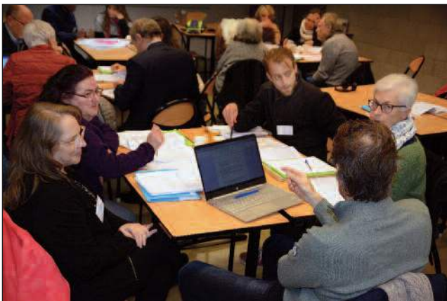
09-10 décembre : Ateliers lors du colloque « Pauvreté, critique sociale et croisement des savoirs », au campus des Grands Moulins de l'université Paris-Cité.

30 août : Visite de volontaires du Sénégal, Burkina Faso et République Démocratique du Congo.