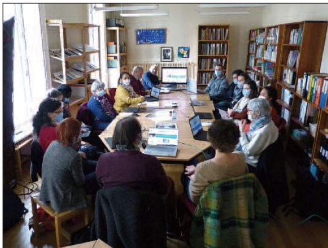
31 mars : Formation à l'utilisation du nouveau centre de documentation en ligne.