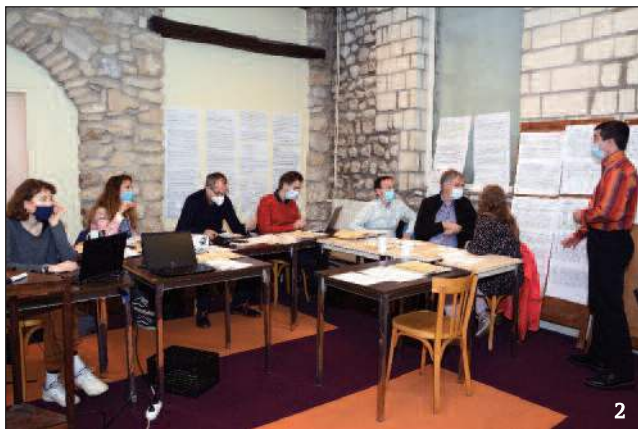
1 et 2 - 27-30 janvier : Séminaire de philosophie sociale. Penser ensemble l'être social avec Joseph Wresinski. Co-écriture des mémoires.