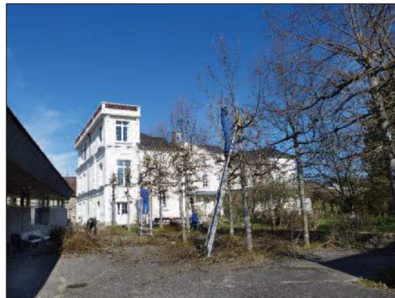
28 février : Élagage des arbres avec l'équipe chantiers Embellissement du centre international.