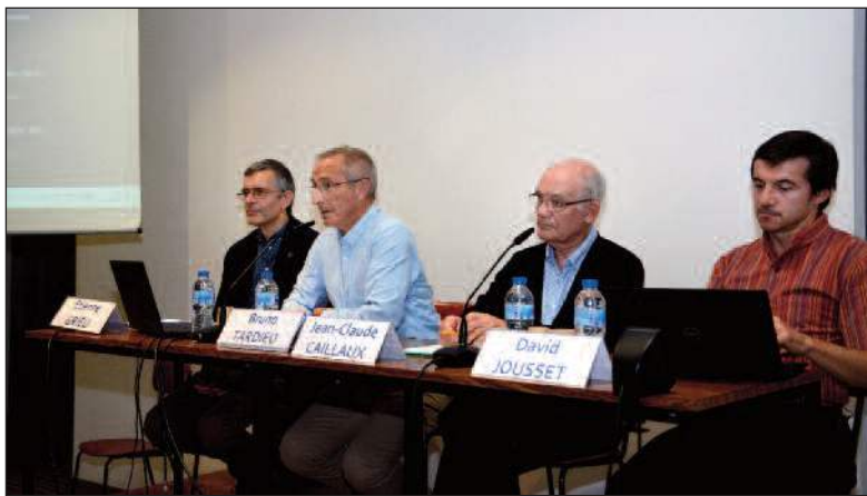
22 octobre : Soirée au Centre Sèvres à Paris, sur le thème « Retrouver du pouvoir d'agir à l'école des plus pauvres. »